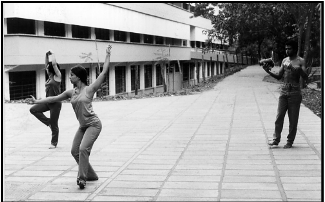
Apresentação da performance “Sons da Floresta”