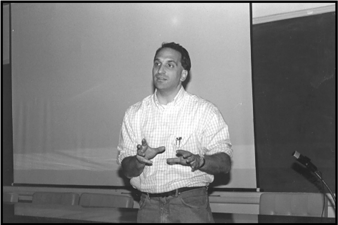
Deputado Fábio Feldmann

tomadas medidas para mitigar os efeitos ou para paralisar as atividades que causam o dano. Acha que a discussão da questão tributária pode dar grandes contribuições para a questão ambiental, por exemplo estabelecendo taxas maiores para produtos mais poluidores, como descartáveis versus biodegradáveis. Em resumo utilizar todos os mecanismos possíveis fora do Capítulo do Meio Ambiente.