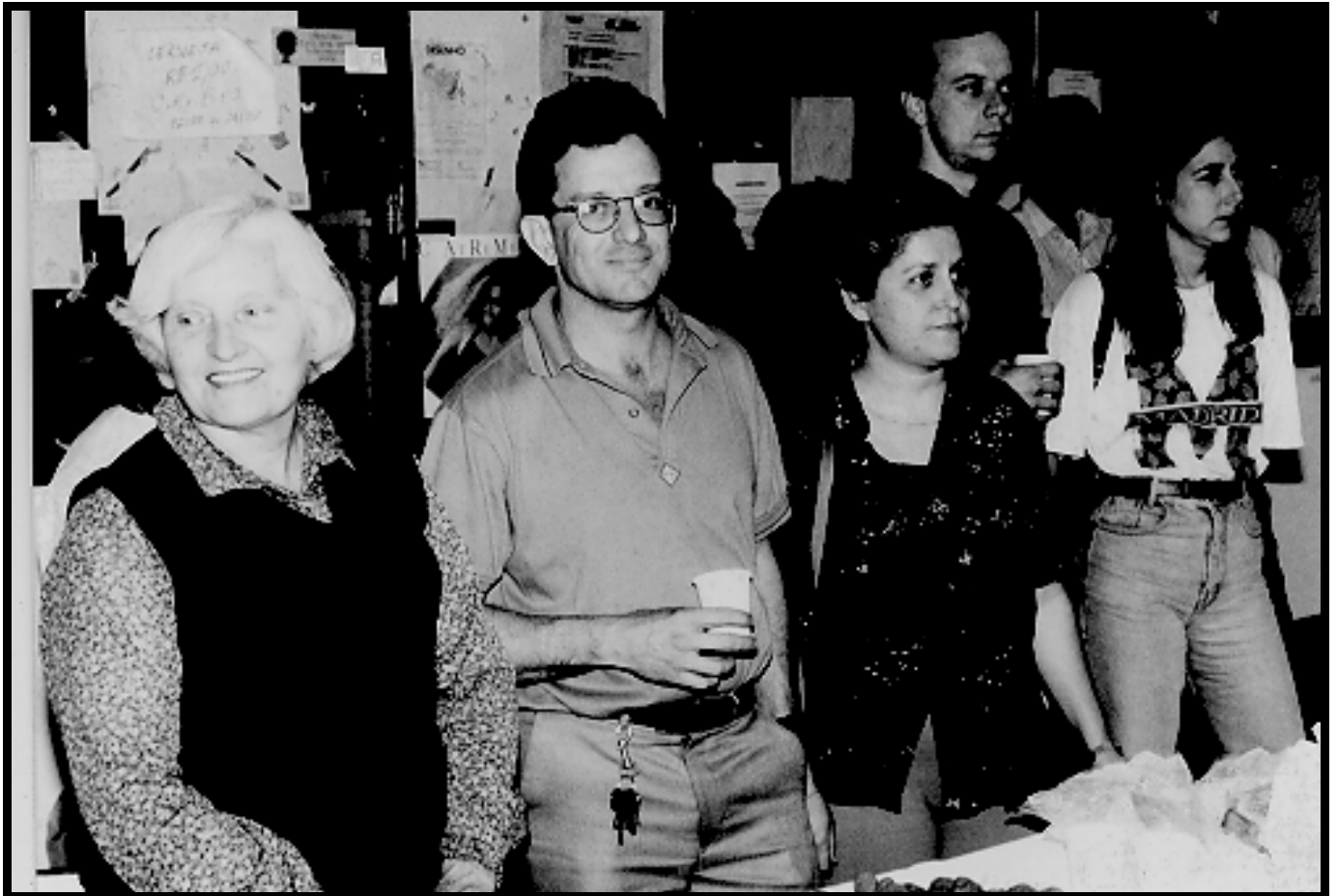
Coquetel de encerramento